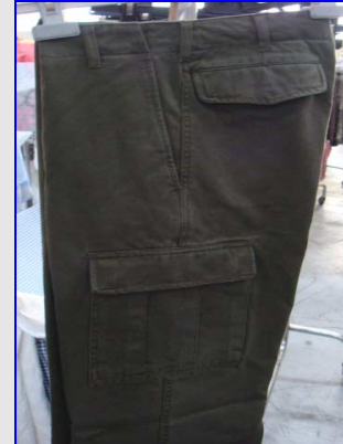
Mod. Pantalone BDU